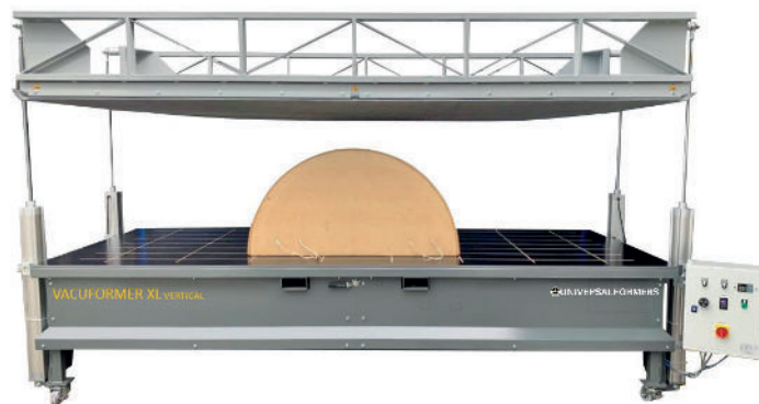
VACUFORMER L, XL, XXL, XL HEATING